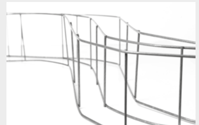
STABLE: LARGEUR PORTANTE 20 CM