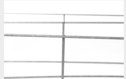
SANS ABOUTS (BREVETÉ)