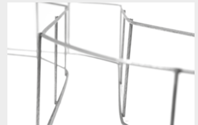
FACILE À DÉPLACER