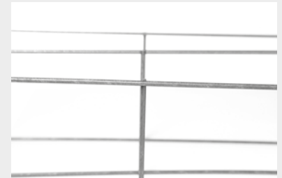
SANS ABOUTS (BREVETÉ)