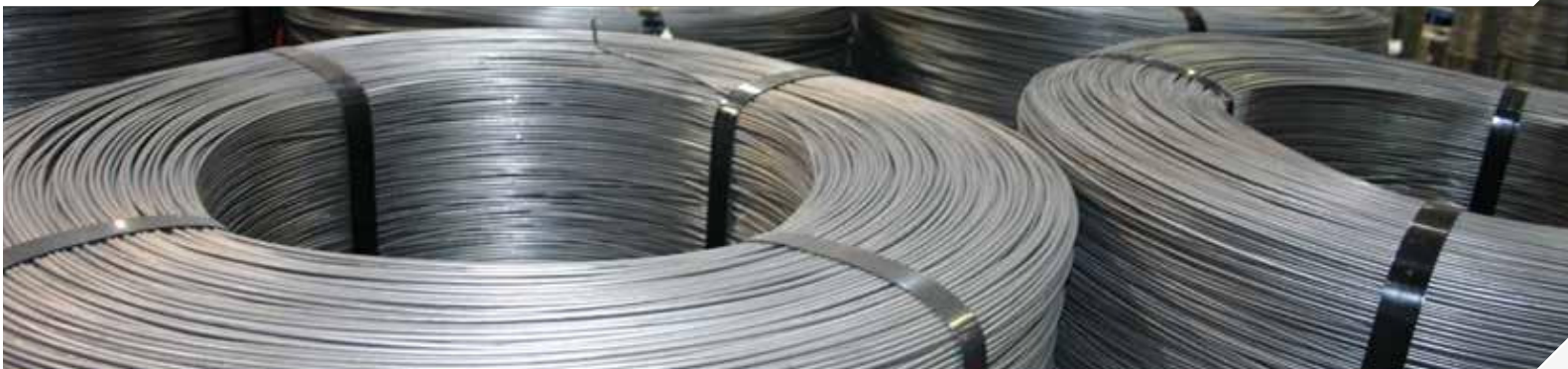
KG / ROL